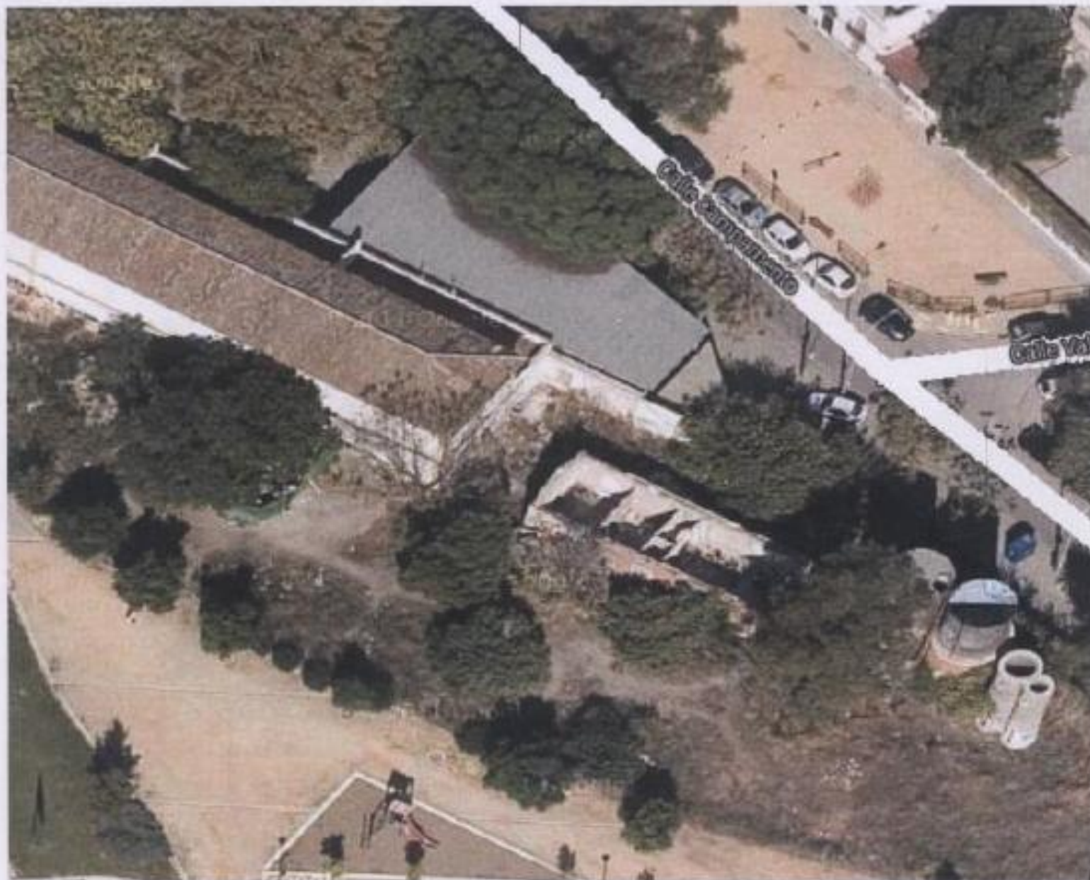
FG-01 VISTA AÉREA DEL CONJUNTO