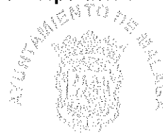
Excmo. Ayuntamiento de Málaga