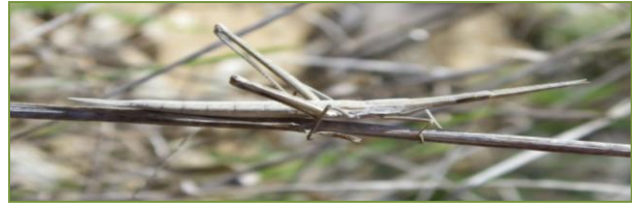
Insecto palo ( Leptynia hispanica )