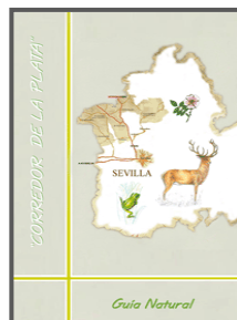
Tomo II: Anfibios, reptiles, mamíferos, árboles y arbustos