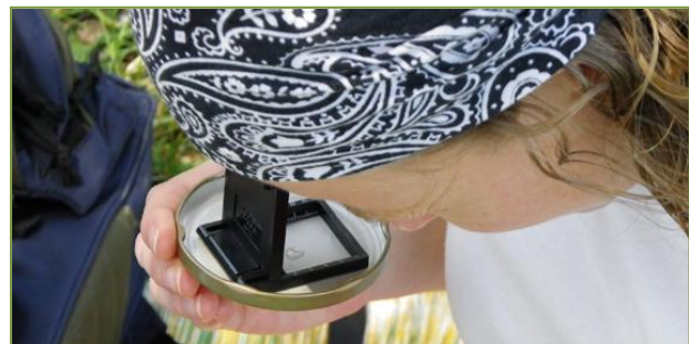
Identificación de macroinvertebrados del río Guadiamar

La Asociación ha aportado diferente material para facilitar la identificación de especies silvestres. Entre otros manuales se han utilizado los dos tomos de Guía Natural Corredor de la Plata que editó en 2007 la propia asociación, en la que se recogen las especies de fauna y flora que habitan en la Comarca: