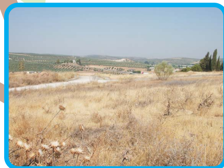
Situación de la parcela antes de acometer este proyecto y vista aérea del lugar donde se localiza.