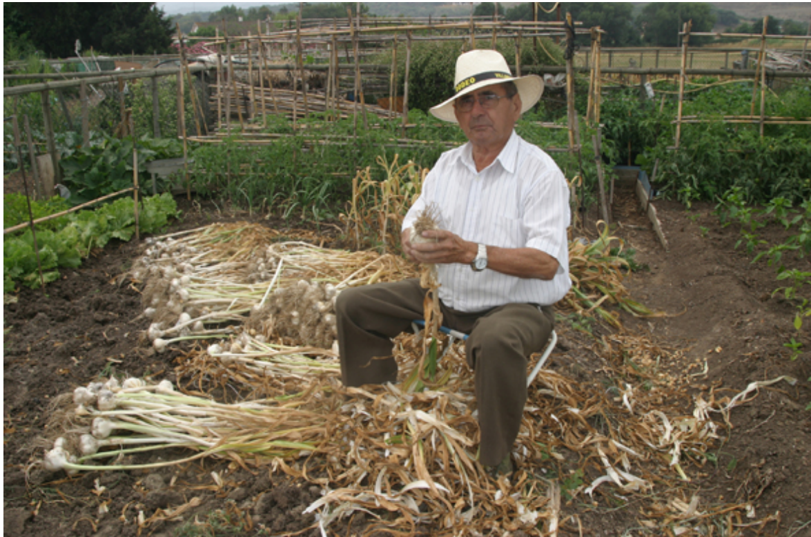
Un hortelano organiza la cosecha de ajos