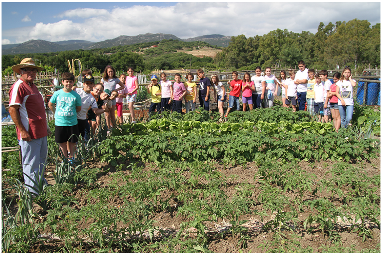
Visita de escolares a los Huertos de Ocio Municipales dentro de la Oferta Educativa anual