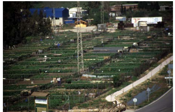
Proceso de Adecuación e Instalación de los Huertos de Ocio Municipales en la Vega del Moral